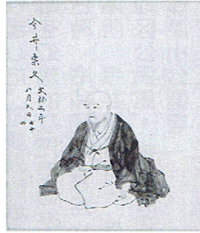
画像より『肖像集』より 今井宗久肖像画 栗原信充/画