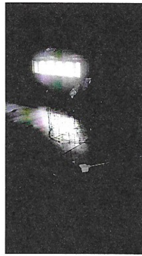
かごの中、蝶番が飛んでいます。

はならあと2019 今井エリア閉幕 はならあと2019が10月27日閉幕 しました。今年は作家の方たちが事前 に何度も今井町に足を運び、今井町 の文化や歴史について勉強されて 芸術作品に昇華されていました。