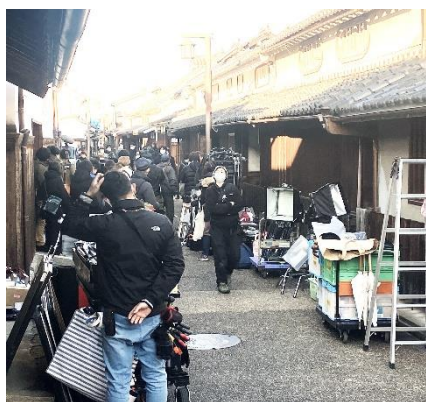
町筋でのロケ風景 主演の目黒蓮さんは、NHK 連続テレビ小説「舞いあがれ！」に出演中

明治・大正期を舞台に描かれた作品で、昨年1月30日、町の各所を使って主人公・久堂清霞(くどうきよか)の実家という設定で撮影が行われました。どのシーンで今井町が出てくるのか公開が楽しみです。