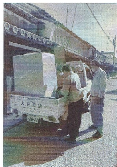
軽トラックで運搬

4月11日(日)午前9時から、春日神社正門右脇に社号標(神社名を石柱などに刻んで建てたもの)の除幕式が挙行されました。