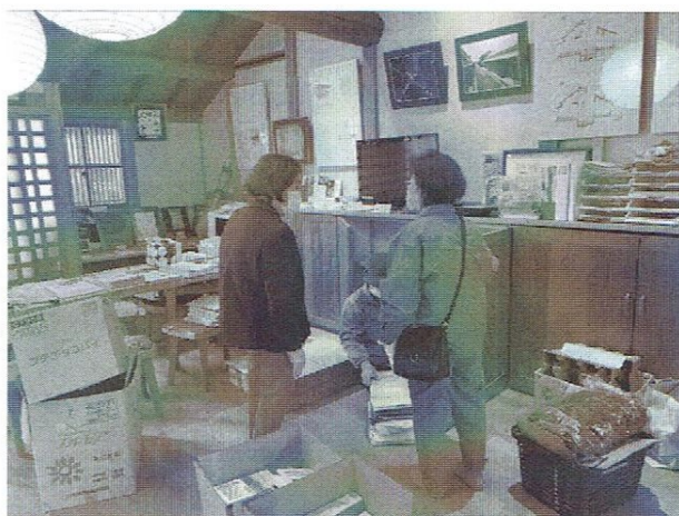
女性の皆さんは町づくりセンターにて、物品の選別仕分けと箱詰め作業。