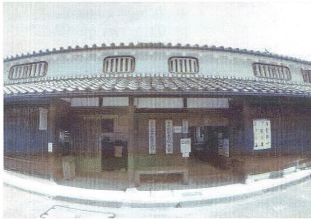
今井景観支援センター(右) 今井町並み保存整備事務所(左) の外観

員会常任理事会で事務所移転の承認を得て、4月1日から新事務所業務を始めています。