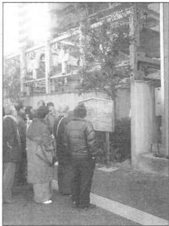
今井屋敷跡は大きなマンションの駐車場の一角にひっそりとたたずんでいます。