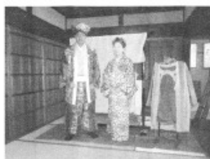
茶行列の衣装を着ての撮影です

きよねんの3月24日にいまいちょうにきました。はじめて日本にきたときには、いまいちょうのことがぜんぜんわかりませんでした。日本でもまだわからなかったから、このすばらしいまちがわかりにくかったです。日本のほうがとてもすばらしかったです。いまいちょうのおてらではじめてさくらをみました。はるのときには、はじめていまいちょうのおてつたいをしました。5月のときにはまちなみさんぽでボランティアをしました。すうっといまいでボランティアをしていいおもいでをたくさんいただきました。いまいちょうでなつになるとたくさんのおもいがあります。いまいちょうまつりあれば、いちにちまえにいまいちょうのひとびとといっしょにくさをぬきました。いまいちょうのまつり「とうかえ」がありました。そのまつりのじゅんぴはたいへんむつかしかったです。とてもたのしかったです。みんながやさしかったです。みなさんからわたしにほんごをおしえていただきました。いまいちょうのひとびとはわたしにしんせつです。なつるときにはまいあそびへいとおきて、ろくじはんごらチオたいそうをしました。