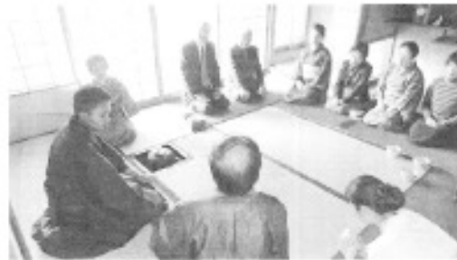
なごりの茶会を開いた時の様子です