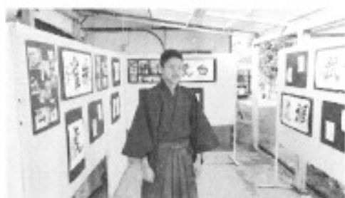
書道の展覧会も開催しました

おしょうがつまえにはひのようじんをしました。はんのじゅうじからにじゅういちじはんまで、いまいちょうのなかにいまいちょうのひとびとといっしょにあるきました。あるくまえにはわたしはおもちとせんざいいただきました。わたしはいまいちょうのひとたちにはもつとしたしかったです。うれしかったです。ことしのいちがつじゅうさんにちはいまいちょうにゆきがたぐさんふりまし