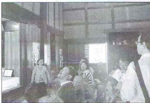
小屋組みの説明を聞き、天井を見上げる参加者の皆さん。

「こちらの家は材木商でしたので、向うの柱と、この柱、二本の柱がこれ大黒柱。材木はケヤキの木を使っているんです。こちら太い方で一尺二寸、40センチ弱あります。しかしね、家の中にね、大黒