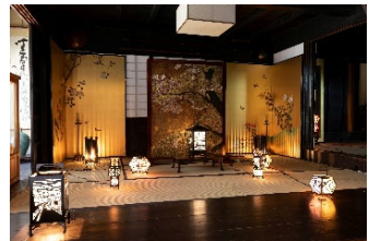
町の幻想あかり展 重文今西家