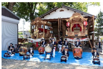
子供太鼓の演奏 春日神社