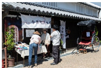
人力車の有料試乗会 中尊坊通り