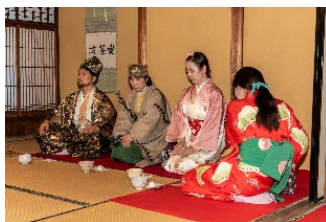
呈茶席 景観支援センター