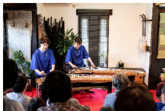
箏のしらべ 藪内家