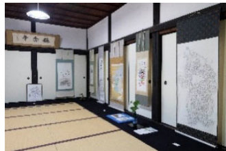
書と拓本の出会い展 称念寺庫裡