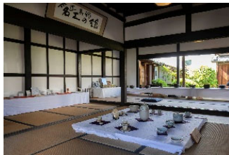
名工の館 重文米谷家