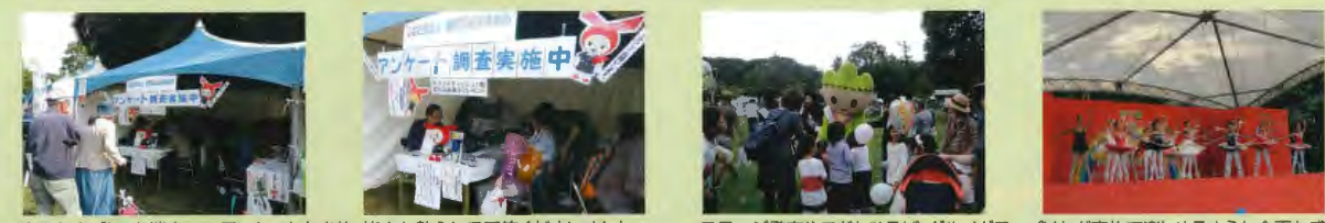
今回もタブレット端末でのアンケートを実施。皆さん熱心にご回答くださいました。ステージ発表や子どもひろば、グルメグランプリなど家族で楽しめるような企画も盛りだくさんで、橿原の秋の一大イベントを皆さんそれぞれに楽しんでおられました。

10月13日(土)・14日(日)、橿原神宮森林遊苑にて「第17回 橿原夢の森フェスティバル」が開催され、地元奈良の物産展や姉妹都市宮崎市の物産展、他にも多くのイベントが行われました。今年も橿原経済倶楽部はアンケート調査で参加しました。お買物アンケート調査を実施させていただきましたところ多くの方から貴重なご意見をお伺いすることができました。今回は話題のクレジットカード・電子マネーといったキャッシュレス決済の認知・利用度合いについても調査致しました。