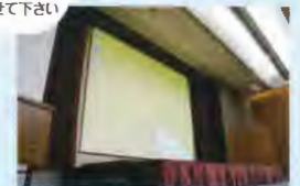
200インチスクリーンサイズ 約W4m×H3m