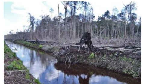
(左/オランウータン 中/サイチョウ 右/破壊された泥炭湿地林)