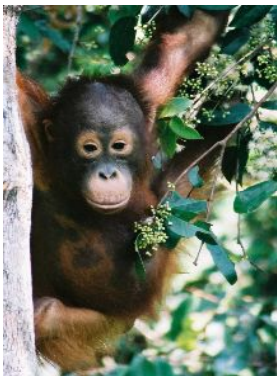
--Save! Indonesian Rainforests, livings, lands, our earth--

協賛団体 * ラミン調査会、特活)国際環境 NGO・FoEJapan、財)地球・人間環境フォーラム JATAN(熱帯林行動ネットワーク) Rainforest Action Network Japan(RANJ)、特活)関西 NGO 協議会、特活)気候ネットワーク