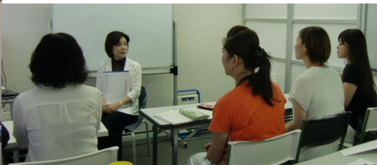
ブラインドメイク講座