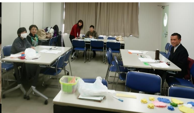
2015 年度いこーらむフェスタ