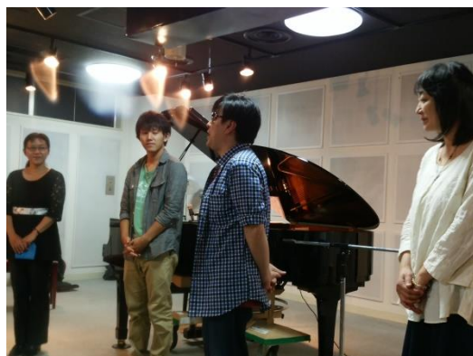
2016 年度カズブーライブ出演者